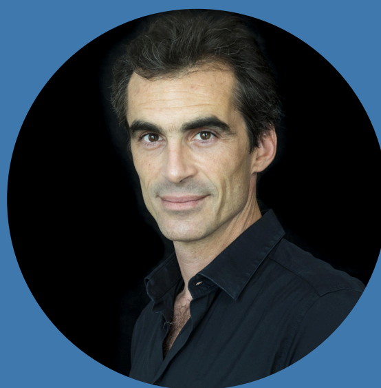
Raphaël ENTHOVEN, philosophe, écrivain, journaliste