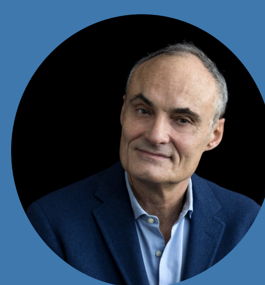
Philippe VAL, journaliste, écrivain, chroniqueur