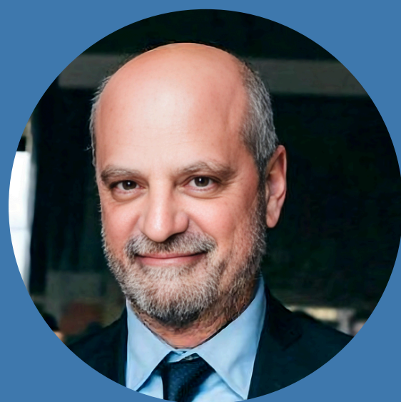
Jean-Michel BLANQUER, ancien ministre de l'Éducation nationale, Président du Laboratoire de la République