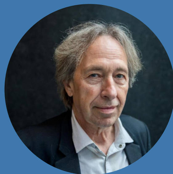
Pascal BRUCKNER, philosophe