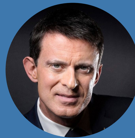
Manuel VALLS, ancien Premier ministre