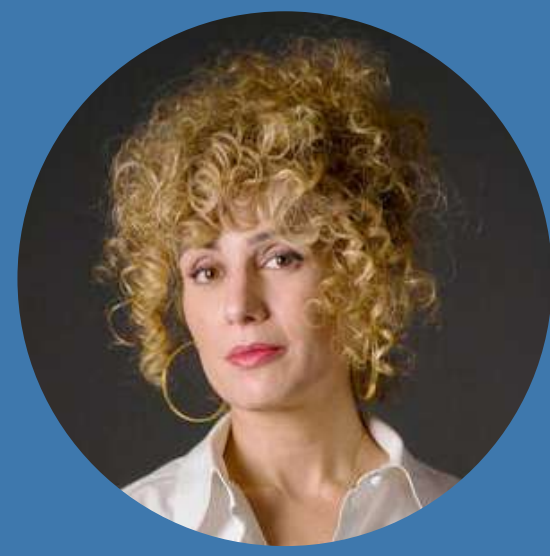
Abnousse SHALMANI , écrivain, chroniqueuse, journaliste