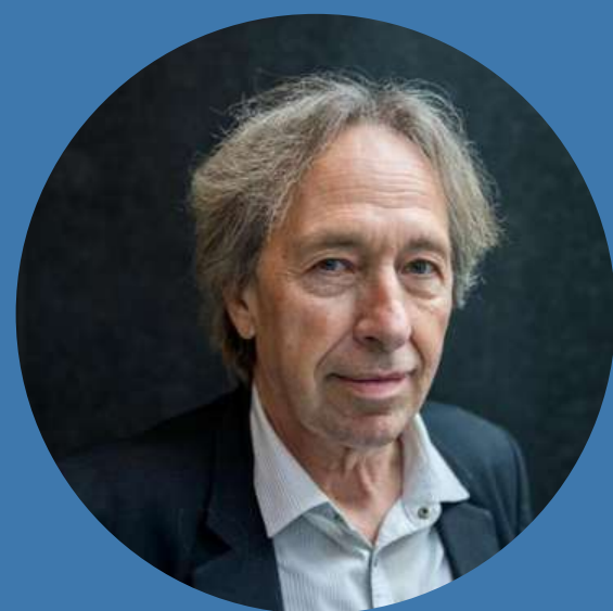
Pascal BRUCKNER , philosophe