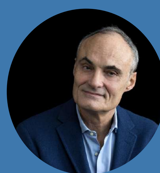
Philippe VAL , journaliste, écrivain, chroniqueur