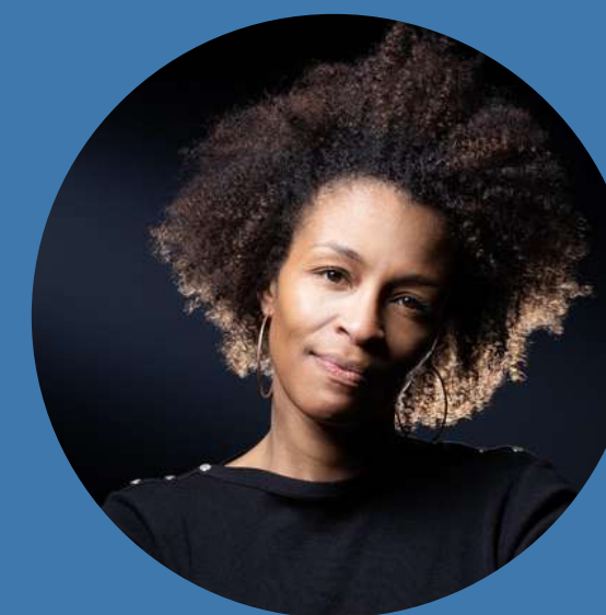
Rachel KHAN , écrivain, éditorialiste, scénariste, comédienne