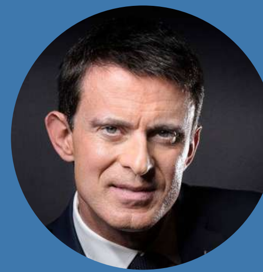
Manuel VALLS , ancien Premier ministre