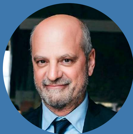
Jean-Michel BLANQUER , ancien ministre de l'Éducation nationale, Président du Laboratoire de la République