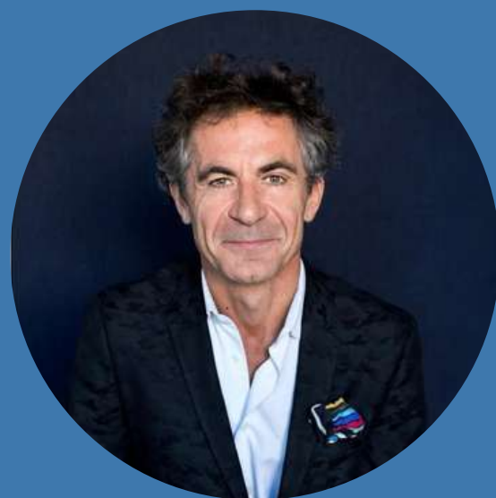
Étienne KLEIN , philosophe des sciences, physicien