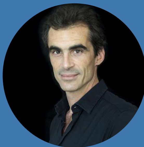
Raphaël ENTHOVEN , philosophe, écrivain, journaliste